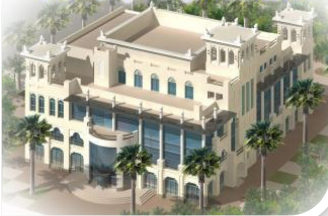
مشروع المركز الحضاري الاجتماعي لأحياء الفيصلية